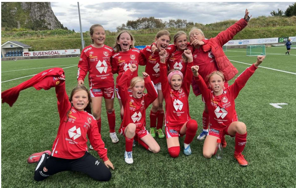
Lagbilde (mangler noen av spillerne)