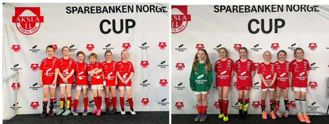
Bilde av laget med nye drakter på Sparebanken Norge cup (2026)