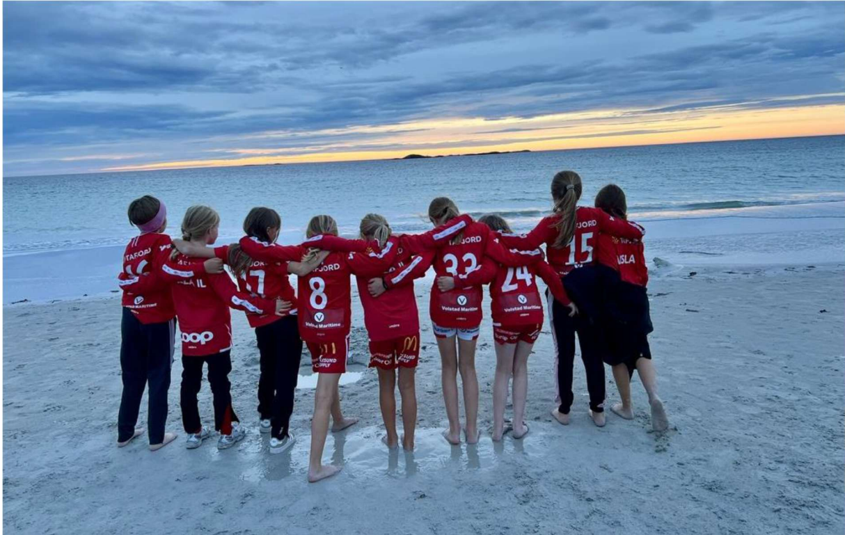
Kveldsbad og mat på Blimsanden