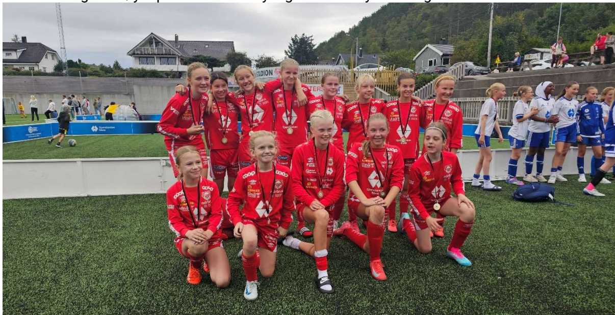
Deler av laget på HessaCup

2026-sesongens høydepunkt blir sannsynligvis Briskebyturneringen i Hamar 6-7. Juni.